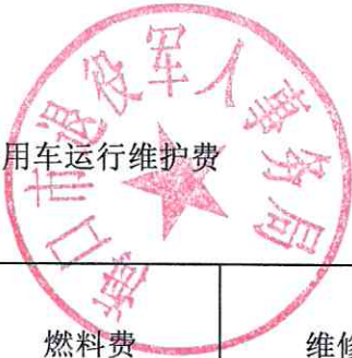
附表14：公务用车运行维护费