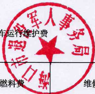
附表14：公务用车运行维护费