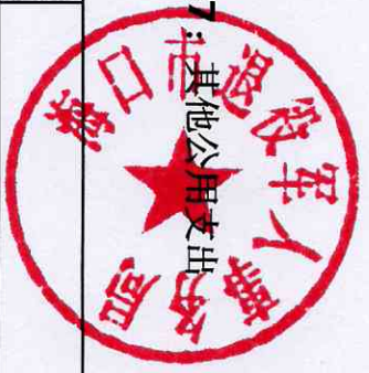
附表27 其他公用支出